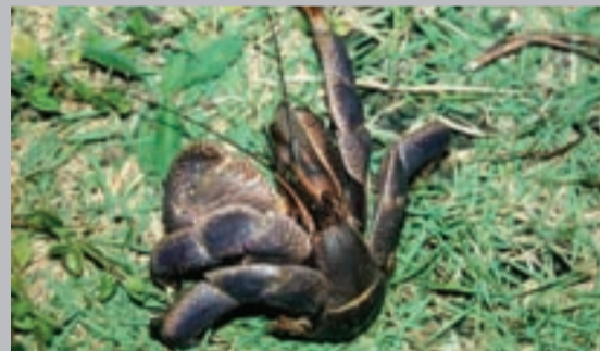
圖4. 沒有房子的寄居蟹捲著身子，保護脆弱的腹部。