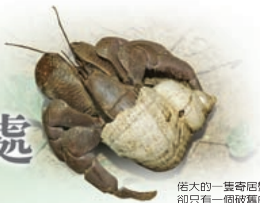
偌大的一隻寄居蟹， 卻只有一個破舊的房子。