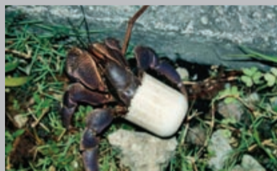
圖3. 海貝越來越少，寄居蟹只好用洗髮精的蓋子來當殼。

「生物多樣性」是這個世紀人類重要的課題之一，多樣的生物是環境穩定和平衡的關鍵。人類已啟動了地球的第6次大滅絕，短短數十年，我們貪婪的入侵生物的棲地，大規模的改變環境，已經有心或無意地將許多生物推向滅絕之路。我們的老祖先很早就有「生物多樣性」的理想，南宋的辛棄疾說：「溪邊白鷺，我來告汝，溪裡魚兒堪數，主人憐汝汝憐魚，要我物欣然一處。」「物我欣然一處」就是維持「生物多樣性」。退休的海洋生物學教授賈福相給生物多樣性下了最好的註解：「多樣就是不同，不同就是大同。」讓我們多一分悲天憫人之心，「物我欣然一處」！