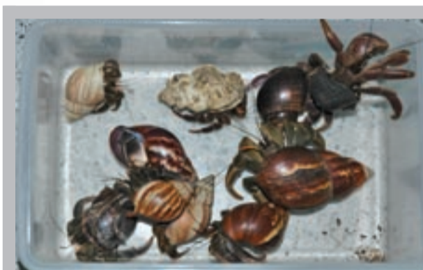
圖2. 10隻寄居蟹中，有6隻的殼是非洲大蝸牛的，3隻是福壽螺的，只有1隻是海貝的殼。

馬路和路燈對生物真的有很大的影響，許多動物是在晚上出來活動，如蛇、蛙、寄居蟹、陸蟹、椰子蟹等，牠們害怕光，所以多選擇黑夜出來活動，我們稱牠們為夜行性動物。牠們會選擇黑暗的路段橫越馬路，所以許多在這裡被壓死。令人訝異的是，10隻寄居蟹中，有6隻的殼是非洲大蝸牛的，3隻是福壽螺的，只有一隻是海貝的殼（圖2）。這說明海邊的貝殼越來越少，寄居蟹找不到合適的房子，只好拿