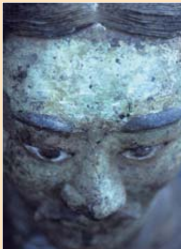
圖5.綠面俑面部俯視特寫