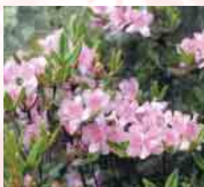
圖4.3 6月南投山區粉嫩嬌紅的南澳杜鵑