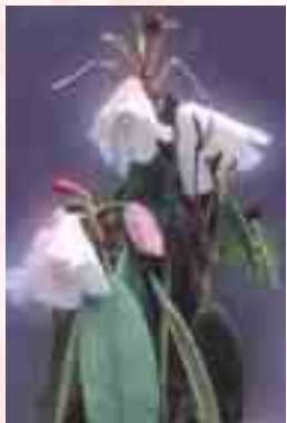
圖2.3 5月綻放的森氏杜鵑