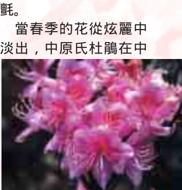
圖3.5 6月花團錦簇的紅毛杜鵑