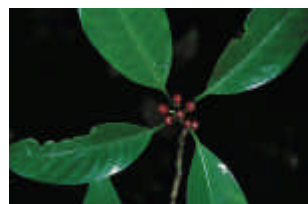
圖 6. 隨著成熟，核果再轉為暗紅色。

蘭嶼九節木的達悟話(雅美話)為 “azakoakoayo”，是當地人用來作薪柴的樹種之一，雖然長在森林內，不過隨便走走也就可以看到，砍伐又容易，所以常在蘭嶼住家可見，不過那些只是枝條了！還是建議您走一趟天池，注意路邊；或是明年歡迎到科博館植物園的蘭嶼區，應該就可以看到這種果色多變的蘭嶼九節木了吧！