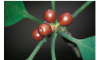
圖 5. 核果逐漸變為鮮紅