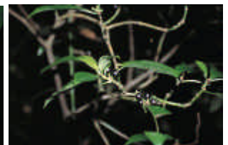
圖 7. 蘭嶼九節木的核果成熟時為黑色