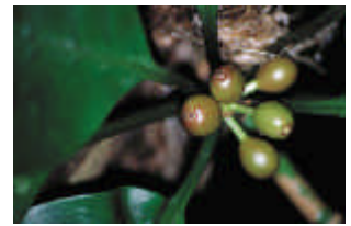
圖 4. 蘭嶼九節木剛結果時為橄欖綠色