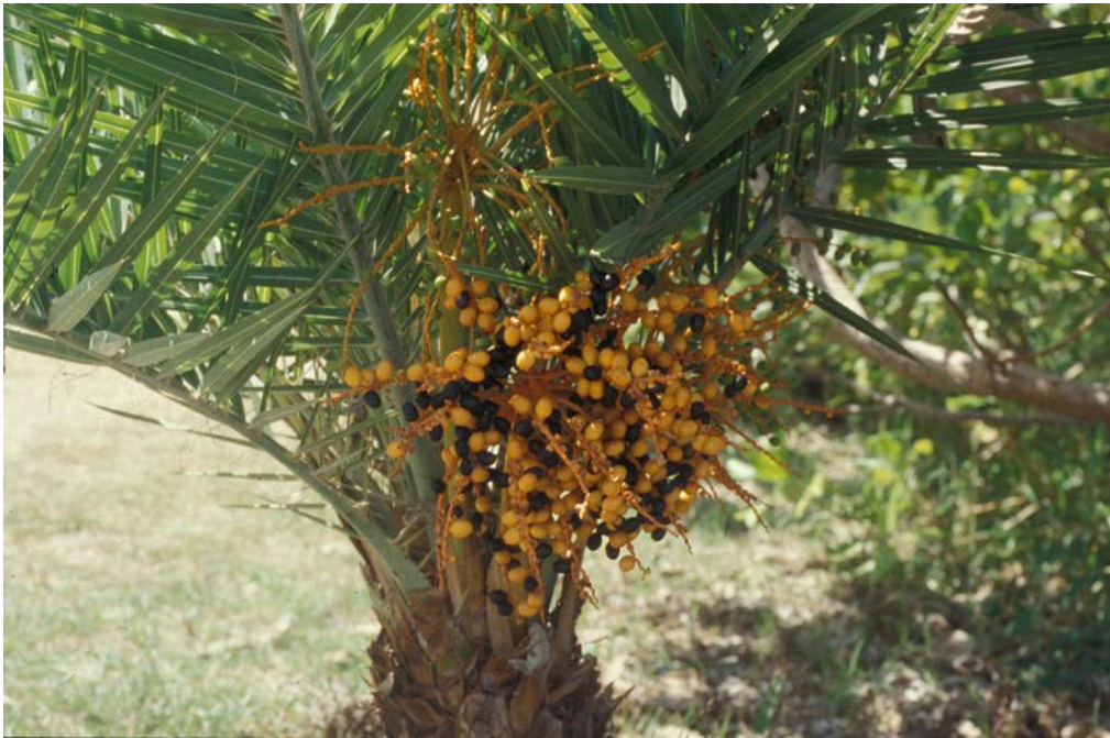
圖 5. 臺灣海棗結實纍纍，葉片可拿來做掃把。