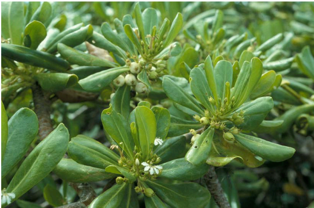
圖 1. 在海邊生長的草海桐，因受風的關係，葉片常向內捲。

黃啓瑞、董景生，2009。邦查米阿勞—東臺灣阿美民族植物。行政院農業委員會林務局，社團法人臺灣環境資訊協會出版。