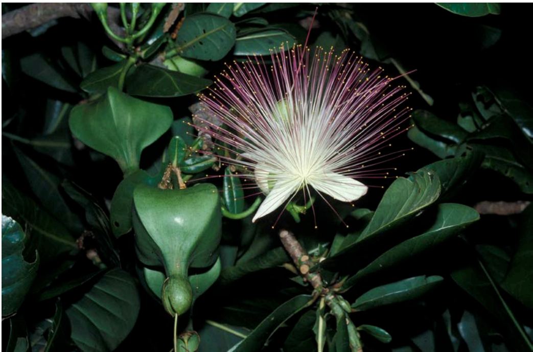
圖 3. 夜間開花的棋盤腳，雄蕊眾多。