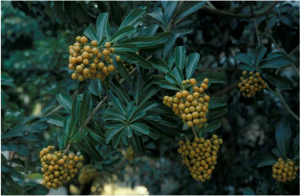
圖 2. 臺灣海桐結實纍纍