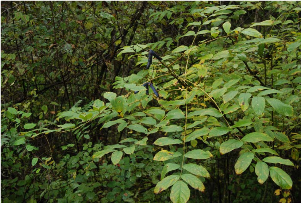
圖 4. 貓兒屎的果實已成熟