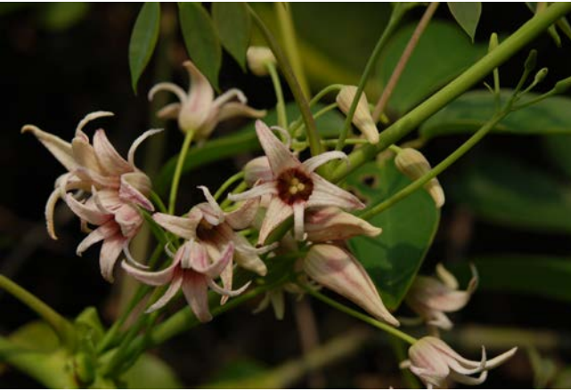
圖 3A. 石月的雌花序