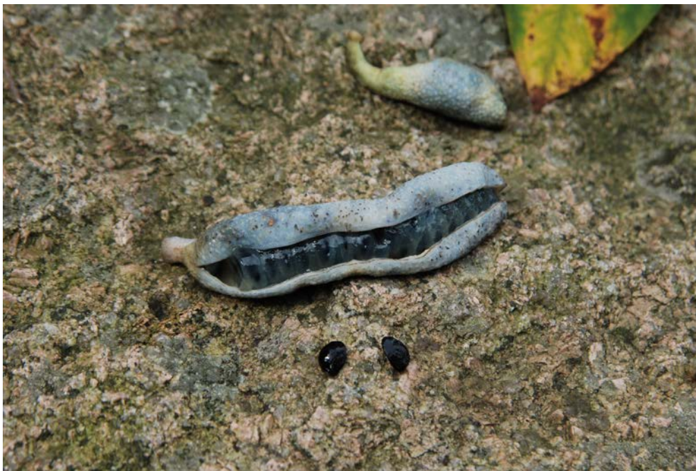
圖 5. 貓兒屎的果像貓兒屎嗎？