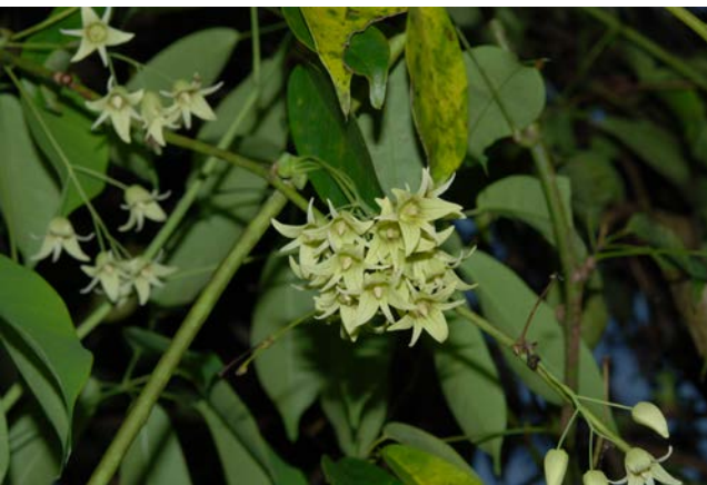
圖 3B. 石月的雄花序