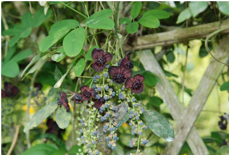
圖 1. 長序木通雌雄花在同一花序上

應俊生、陳德昭，2001。木通科 小檗科。中國植物志。中國科學院中國植物志編輯委員會，科學出版社。