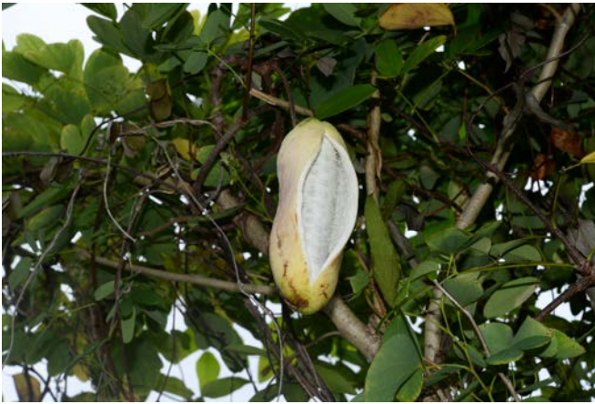
圖 2A. 長序木通果實成熟後開裂