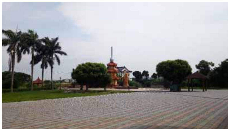
圖 4. 鹿港第一公墓

彰化縣鹿港第一公墓（圖 4）鄰近菜園角遺址，其碳十四的年代約距今 700 ~ 300 年前後，相當於史前時代最晚階段到歷史時期初期。學者認為可能為巴布薩族馬芝遴社所在，馬芝遴社與東螺社、二林社、眉裡社、半線社、柴仔坑社、阿東社、西螺社（圖 5）都在彰化平原。日前弘光大學廖倫光老師團隊於鹿港第一公墓監看時發現番仔園文化晚期的陶片（圖 6），其中一片泥質灰陶罐口的弦紋與盛清沂先生於新北市大坵坑遺址上層採集的相似（圖 7 取材自劉益昌等十三行博物館館藏後續研究—考古標本登錄暨分析計畫期末報告，2009）。