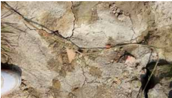
圖 6. 鹿港公墓地表的番仔園文化晚期陶片