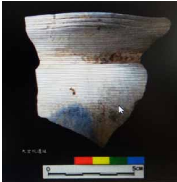
圖 7. 盛清沂先生於大坵坑遺址上層採集的陶片