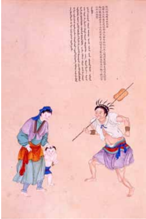
圖 5. 西螺社熟番(清謝遂職貢圖)