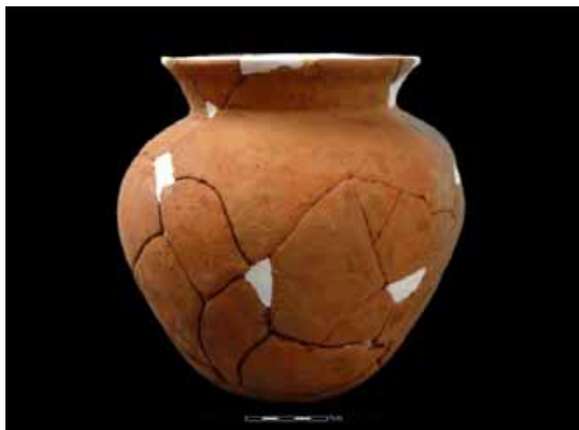
圖 3. 知高遺址出土的紅褐泥質陶罐

遺物大部分為陶容器殘件，包含陶罐、陶甌、圈足、陶鉢、陶紡輪、碗形陶蓋等，以灰黑、紅褐泥質陶（圖 3）為主，其厚度可達 10~15 公釐，口徑亦大。石質遺物包含石鎚、砥石、砍砸器、石片器、打製石鋤、石核等，顯示當時雖已進入鐵器時代，然生產工具仍以石質為止。生態遺留包含炭、獸骨、炭化稻米、圓果青剛櫟、苦楝等，另外有管狀琉璃、梭狀瑪瑙等貿易物。