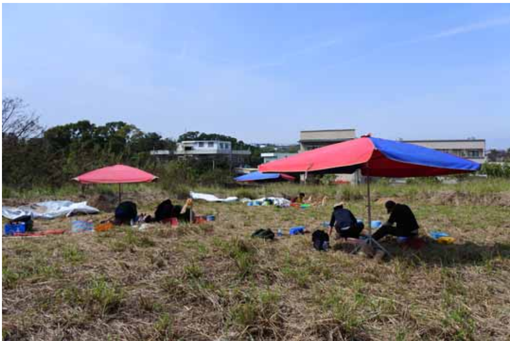
圖 4 牛埔遺址工作現場