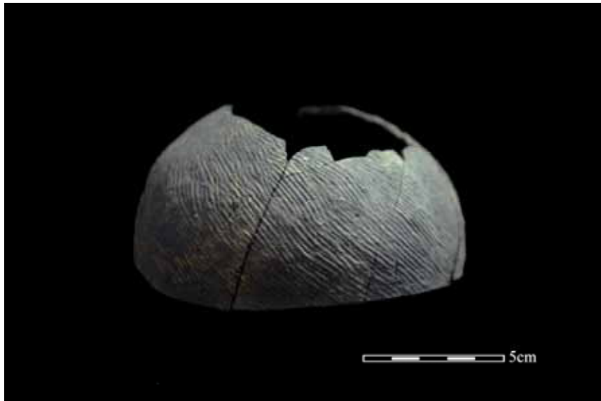
圖 3 繩紋黑陶鉢側視圖