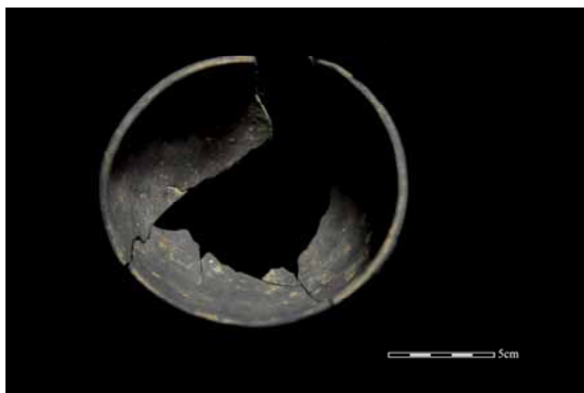
圖 2 繩紋黑陶鉢上視圖