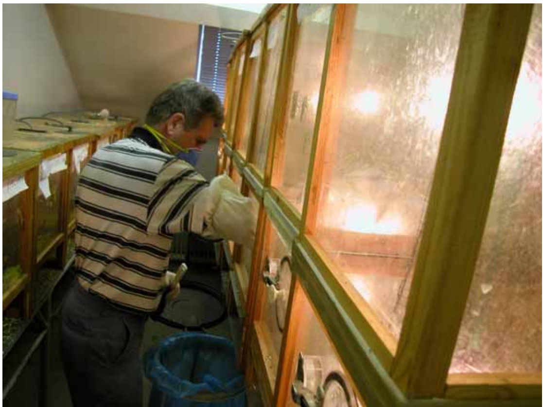
圖5. 研究人員正在給群居型蝗蟲食物及清理養蟲箱