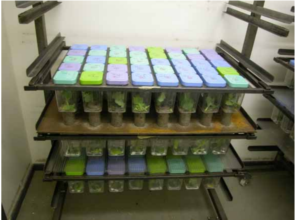
圖4. 研究散居型蝗蟲時需單獨飼養