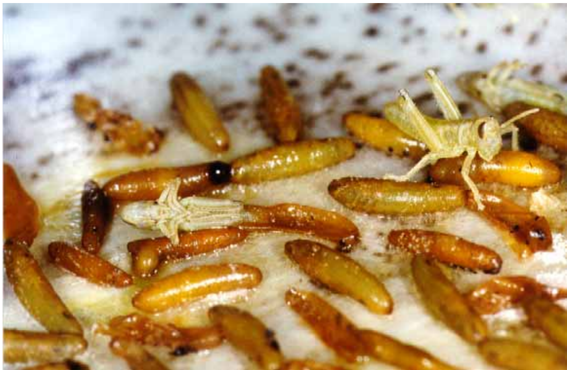
圖1. 正孵化的蝗蟲幼蟲及蝗蟲的卵

家蠶屬完全變態昆蟲，在一個世代中，經過卵、幼蟲、蛹、成蟲4個形態特徵完全不同的發育階段。當蠶蛾產下卵後，一般來說，都不會孵化而進入休眠狀態，休眠期歷時達10個月左右至翌年春暖才會孵化（圖6）。但也有非休眠卵品系，在產卵後第10或11天後孵化，休眠卵也可以在產下卵後第2日通過用液溫46℃、比重1.075的稀鹽酸液浸漬5~5.5分鐘，使其不進入休眠而直接孵化（於25℃環境下在10日內即可孵化）。我們利用電泳及西方點墨法(Western blotting) 偵測組蛋白之磷酸化及乙醯化後發現，蠶卵的休眠與否與組蛋白的化學修飾密切相關，在休眠卵內，組蛋白之磷酸化及乙醯化水平極低，在非休眠卵以及用鹽酸處理後的發育卵中，組蛋白之磷酸化及乙醯化在卵之中期升至很高水平，從而導致與胚胎發育的相關基因表達量增加，此一發現在昆蟲學研究領域首次證明了表觀遺傳學(組蛋白之化學修飾) 參與卵的休眠。