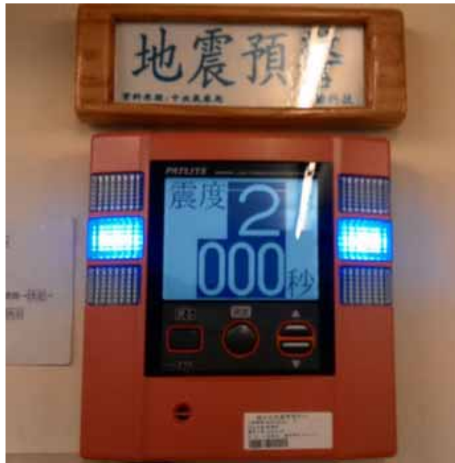
圖 3. 921 地震教育園區現地地震預警系統警報器運作中捕捉畫面。本設備由三聯科技公司捐贈