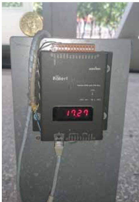
圖 4. 921 地震教育園區現地地震預警系統現地 P 波偵測器。本設備由三聯科技公司捐贈。