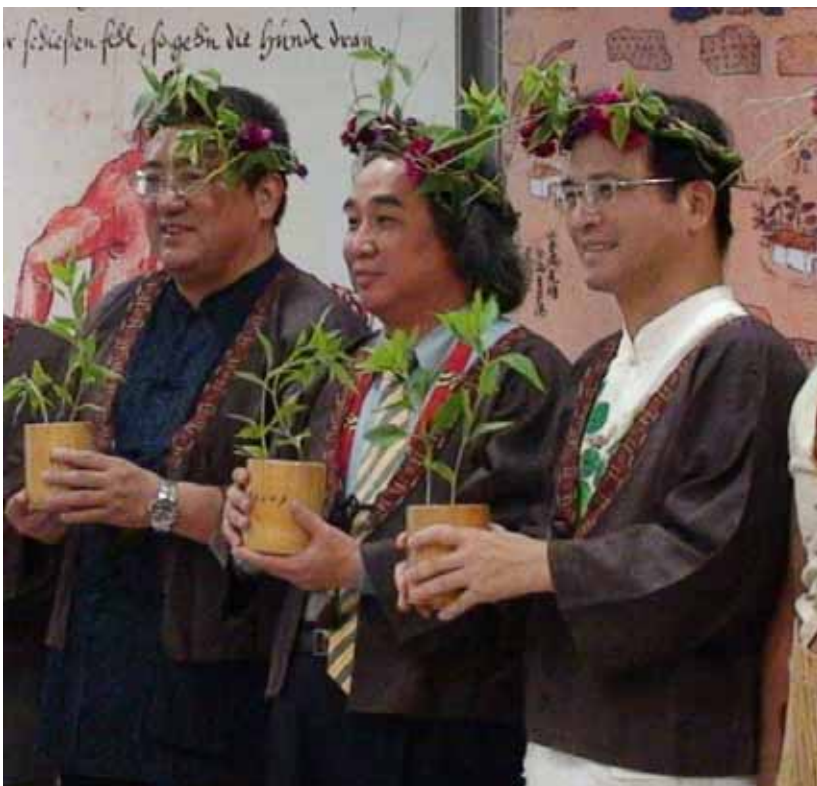
2006年臺南縣（今臺南市）政府認定西拉雅族為縣定（今市定）原住民族，成為第一個中央政府未認定但地方政府認定的原住民族。