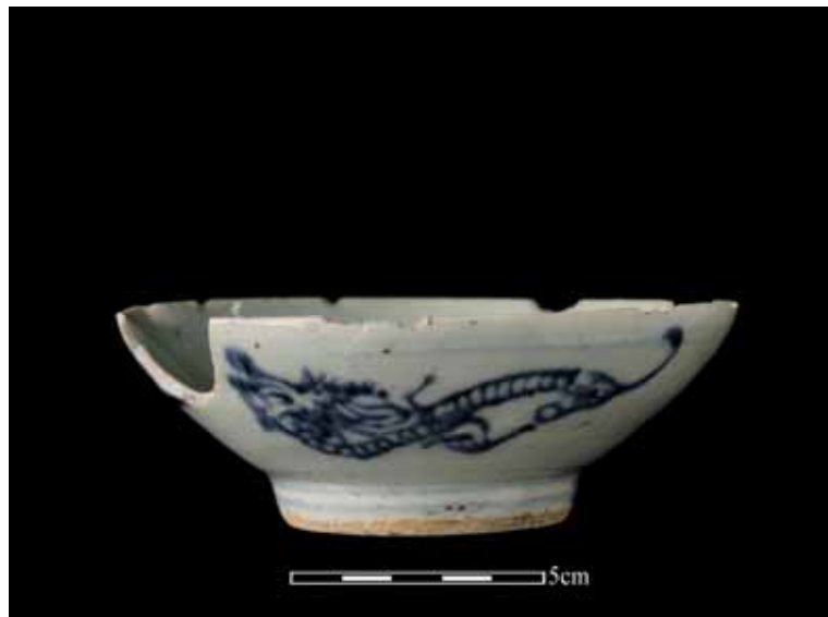
清代晚期的青花瓷碗