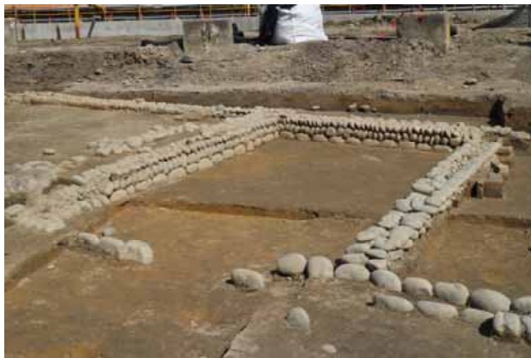
石頭排列而成的牆基