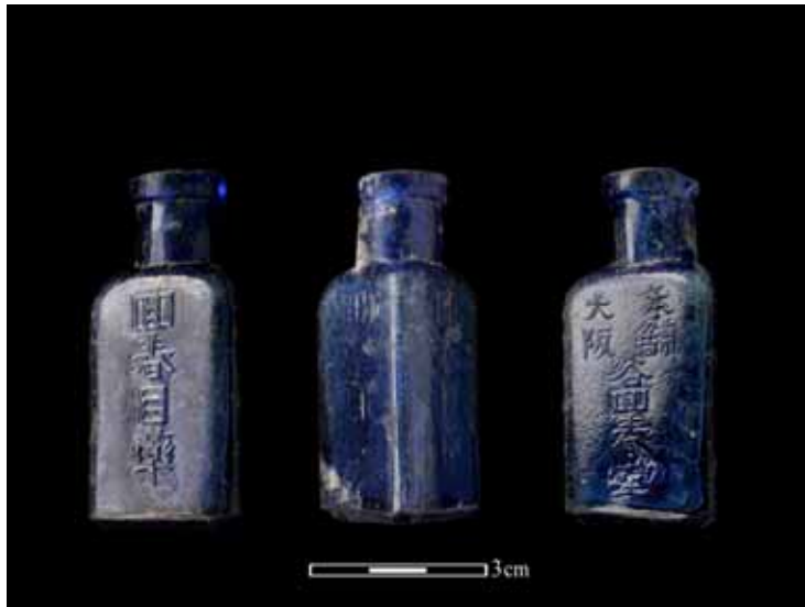
日據時代的眼藥水瓶