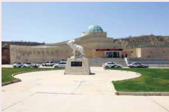
圖4. 和政古動物化石博物館