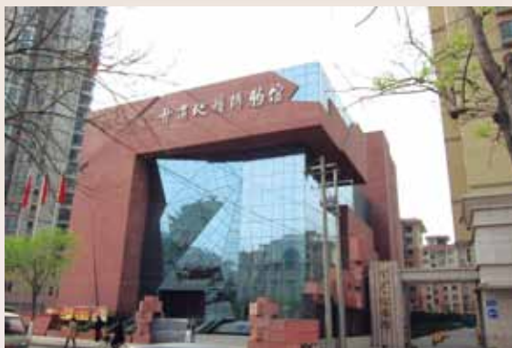
圖3. 甘肅地質博物館