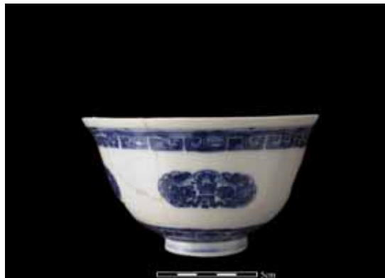
圖 3. 青花瓷團花獸紋蓋碗