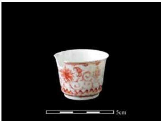
圖 7. 釉上紅彩小杯