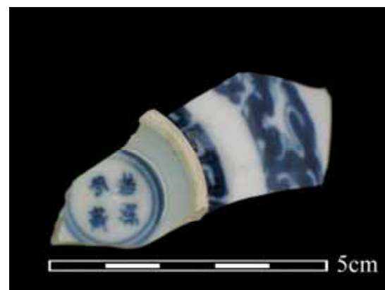
圖 8. 若深珍藏