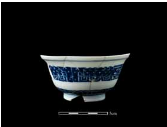
圖 2. 青花瓷夔龍紋蓋碗

蓋碗一般包括蓋、杯、托 3 個部分，是清代官場流行的飲茶方式，所泡的茶以綠茶為主。喝茶時不必揭蓋，只需半張半合，茶葉既不入口，茶湯又可徐徐沁出。若要茶湯濃些，可用茶蓋在水面輕輕刮一刮，使整碗茶水上下翻轉，輕刮則淡，重刮則濃。板頭村出土的清代蓋碗，全是景德鎮的產品，有青花瓷夔龍紋（圖 2）、青花瓷獸紋團花（圖 3），以及釉上彩瓷黃地軋道花卉紋（圖 4）等類別，製作得都很精緻，只可惜出土物沒有茶托。