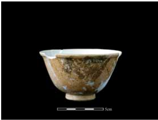
圖 4. 黃地軋道花卉紋蓋碗