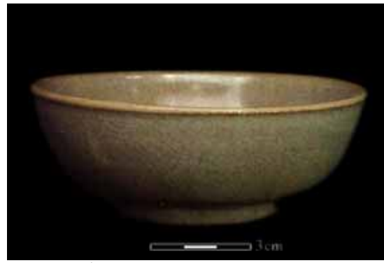
圖 10. 青瓷茶海