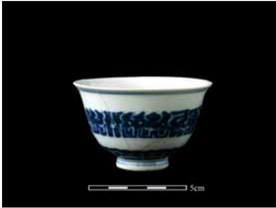
圖 9. 青花瓷夔龍紋大杯