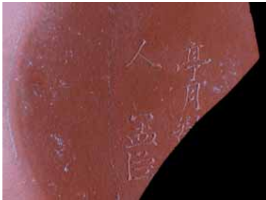
圖 5. 孟臣款朱泥小壺

板頭村出土的小茶杯數量很多，包括景德鎮與德化窯製造的，青花瓷（圖 6）與釉上紅彩瓷（圖 7）都有。其中有一件杯底有「若深珍藏」款的小杯（圖 8），為康熙年間著名的瓷器，是景德鎮民窯製品。