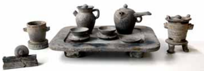
圖 1. 唐代石質茶具

本館館藏一套唐代石質茶具（圖1）陪葬品，是仿造當時茶具的外形，各件依不同的比例縮小，不是實用的器物。包括茶碾、風爐、水鍍（也可稱為水釜或水鑊）、托盤、茶瓶、茶盞（碗）、茶托、小碟等，可以和陸羽《茶經》中記載的唐代茶具相互印證。還有兩件比較不能確定名稱與功能的器具，一件如桶狀，無底，兩側帶有獸面把手，與風爐的大小與造型相應，推測可能是不燒水時，放置水鍍的器具，似和陸羽茶經中稱為「交床」的器物功能相同。另一件是單柄壺，或許可稱為「銚子」，可以直接放在火上燒水。