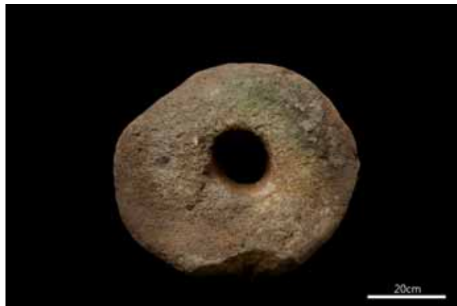
圖 5. 石輪

石輪也稱為有孔石盤，呈扁圓形，中央帶有一個穿孔，形狀像是特大的甜甜圈。施教授共捐贈 4 件，其中 3 件完整，1 件殘破。3 件的材質是安山岩，1 件是凝灰岩。最大的一件直徑 60 cm，厚 18 cm，其中有 2 件穿孔是方形的，1 件穿孔是圓形的。