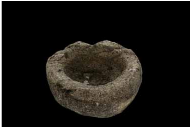
圖 7. 石臼

活動，未來在本館展出後，更可以讓觀眾親眼目睹數千年前的巨石器，這樣難得的經驗與感動，都要感謝施教授當年的辛勞以及慷慨的捐贈。