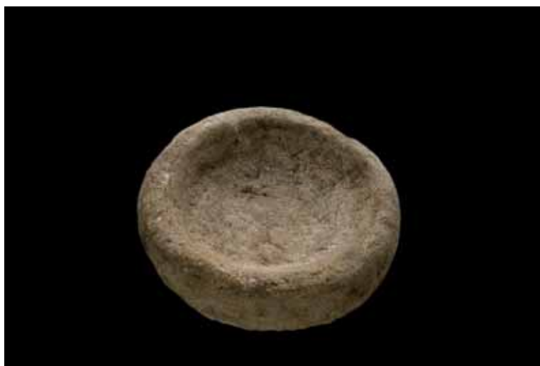
圖 6. 石盤

共有 3 件，其中只有 1 件完整，另外 2 件殘破。完整石盤的質地為凝灰岩，直徑 45 cm，高 13 cm，加工細緻，周圍是圓形，底部平整，內側呈圓弧形，可能是處理食物的容器或工具。殘破的石盤質地包括安山岩與砂岩，可能是長方形的。