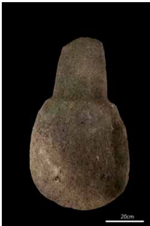
圖 2. 有肩單石

單石。在 5 件標本中，4 件大致完整，只有 1 件上端折失一段。其中最大的一件標本高 84 cm、寬 51 cm、厚 22 cm，最小的一件高 42 cm、寬 21 cm、厚 15 cm，其他 3 件的尺寸介於兩者之間。根據臺灣史前文化博物館的李坤修先生鑑定，其中較大、較寬的 2 件標本，可能出土於臺東縣成功鎮至白守蓮一帶，因為當地的單石一般器型較大；其他 3 件較小、略呈圓柱體的標本，可能出土於臺東縣長濱鄉忠勇遺址，因當地出土的單石加工較少，下端多呈天然形狀。