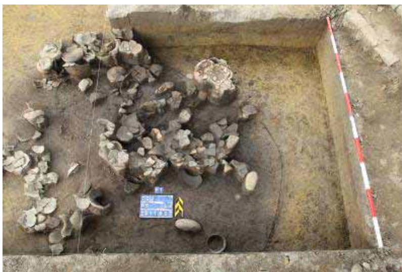
圖 4. 灰坑 F1