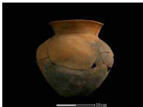
圖 5. 陶容器

本次發掘在 P1、P2、P3、P5、P12 等探坑下層，出現零星的粗砂陶片，數量很少，一共只有 220 小片。顏色多為紅褐色或紅褐色皮夾灰胎（圖 5），表面滾磨嚴重，無法看出原來有沒有繩紋，也無法看出器型，可能受過水沖積，已經脫離原來的脈絡關係。陶片質地與 1996 年採集的繩紋陶片相似，可能屬於牛罵頭文化，但目前無法絕對確定。