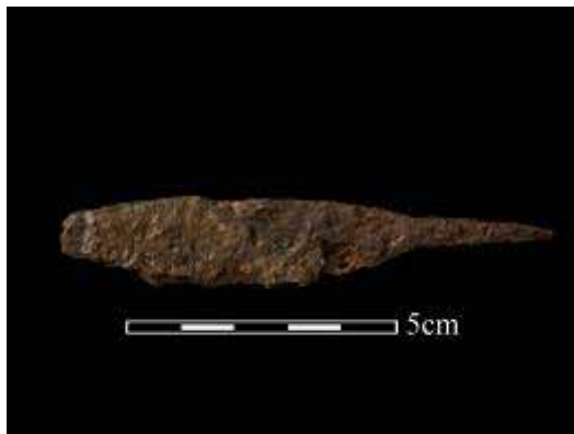
圖 6. 鐵器

這次發掘，在 P7L2，也就是灰坑 F2 的表面，出土了 1 件近完整的鐵器，可能是一把小刀，也可能是支矛頭。器身呈扁平的長條型，一側有刃邊，另一側是鈍的；一端有銼，用來裝柄，但應為刀尖或矛頭尖鋒的部位已經損傷。