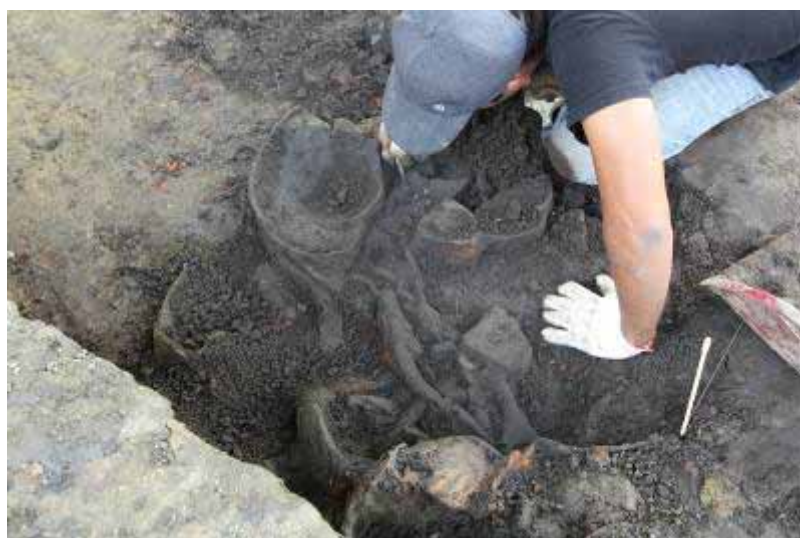
圖 3. 發掘灰坑