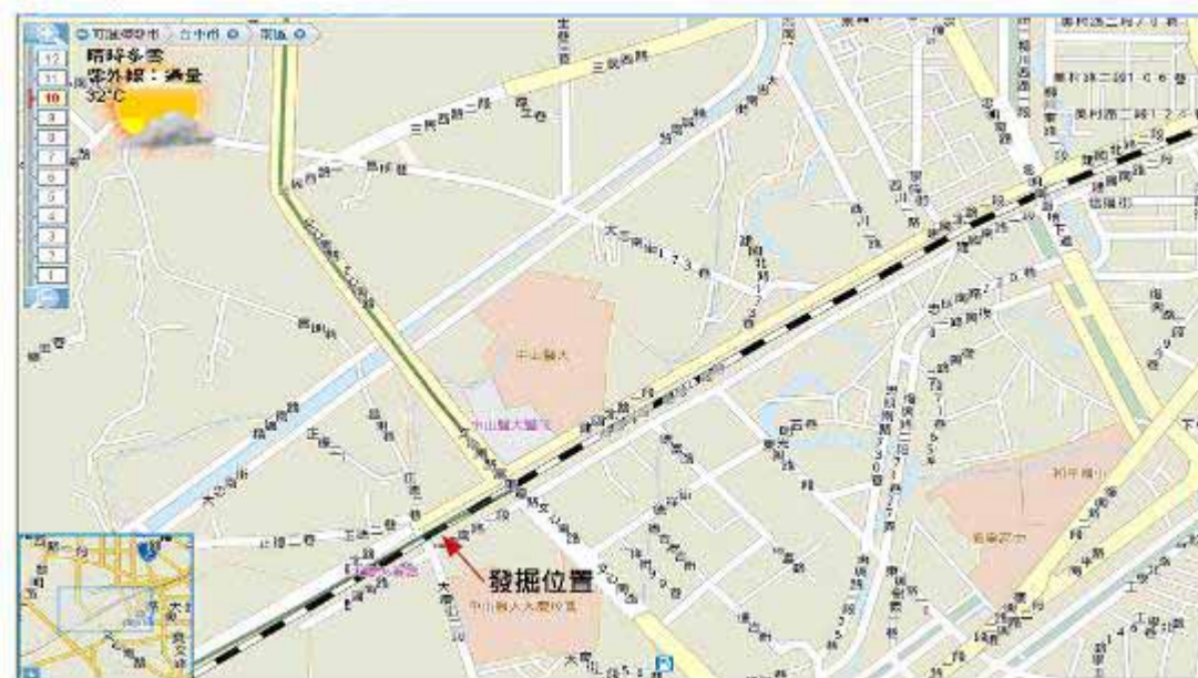
圖 1. 大慶街遺址發掘地點

「交通部鐵路改建工程局中部工程處」目前正在進行「臺中都會區鐵路高架捷運化計畫」，要將臺中市區原有的平面鐵路改建為高架鐵路。2011 年 5 月，工程單位在大慶街平交道附近，挖出一些史前陶片。按照文化資產保存法的規定，應於工程前辦理考古調查、施工中監看與搶救發掘工作。因此委託本館執行「臺中市大慶街遺址、中山 II 遺址考古試掘與監看計畫」。目的在透過考古試掘的方式，確定鐵路改建工程的橋墩位置地下是否埋藏有史前的遺物與遺跡？如果橋墩位於考古遺址範圍之內，就要進行考古搶救發掘，以保存重要的文化資產。