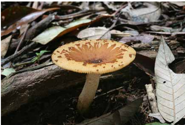
點柄黃紅菇 Russula senecis Imai (圖 8)

這種中型紅菇，土黃色的外表，加上菌柄表面有著暗褐色腺點，因而得名。全株散發著一股難聞的腥臭味，彷彿提醒眾人它是個毒菇，不要太靠近。一旦誤食會出現嘔吐、腹瀉等腸胃型中毒症狀。