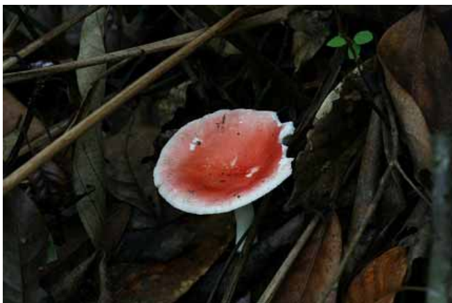
圖 5. 毒紅菇

毒紅菇 Russula emetica (Schaeff.: Fr) S. F. Gray (圖 5)