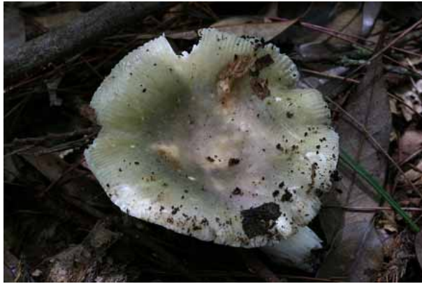
圖 12. 藍黃紅菇

藍黃紅菇（雜色紅菇） Russula cyanoxantha (Schaeff.) Fr. (圖 12)