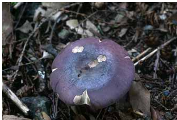
圖 11. 青黃紅菇

這種中大型菇類，有一般菇類少見的亮綠色菌蓋，搭配著白色的菌柄與菌褶，模樣十分獨立，洋溢著大自然的清新氣息，英文俗稱其為綠紅菇（Green Russula）。可食，但也有記載有毒。