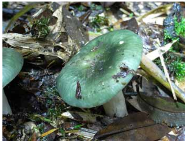
圖 10. 銅綠紅菇

這種中型菇類，淡綠色的菌蓋表面常形成拼布般的灰綠色塊斑，花樣就像國外常用的百納被，因此英文俗稱其為綠棉被紅菇（Quilted Green Russula）。可以採食，有股榛果的氣味，味道絕佳；另外也可藥用，據文獻記載其「主治眼目不明，散熱舒氣，但不可多食，食之宜以薑為使」。