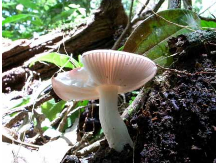
圖 1. 毒紅菇

「紅姑伊兒是紅吱吱.....」，每當在野外發現紅菇屬的菇類時，心中總會響起兒時電視劇「火燒紅蓮寺」的主題曲，然而紅菇屬一定是紅色的菇嗎？那可不一定，其實它色彩豐富，從標準的紅到黑、白、紫、黃、橙、褐外，還有菇類少有的綠呢！紅菇屬大多具有白皙的皮膚、婀娜多姿的身材，再搭配上適宜顏色的帽子(菌蓋)，那副晶瑩剔透，彈指可破的模樣，真教人愛憐。