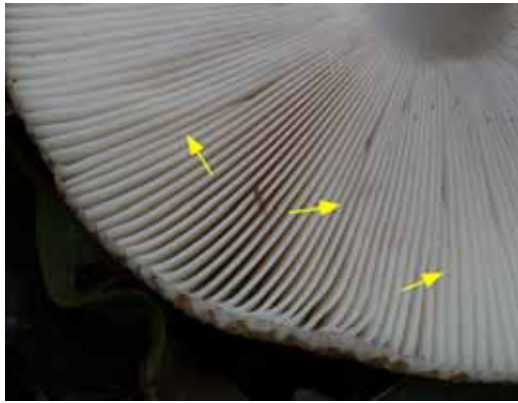
圖 2. 罕有小褶(箭頭處為小褶)