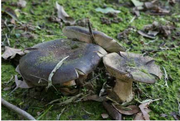
圖 15. 密褶紅菇

密褶紅菇（變紅紅菇） Russula densifolia (Secr.) Gill. (圖 15)