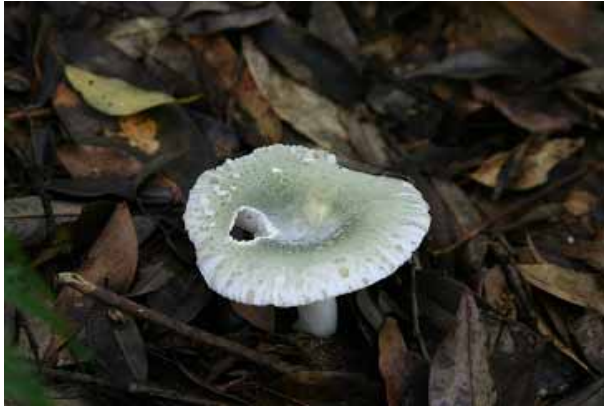
圖 9. 綠紅菇

綠紅菇（綠棉被紅菇） Russula virescens (Schaeff.) Fr. (圖 9)