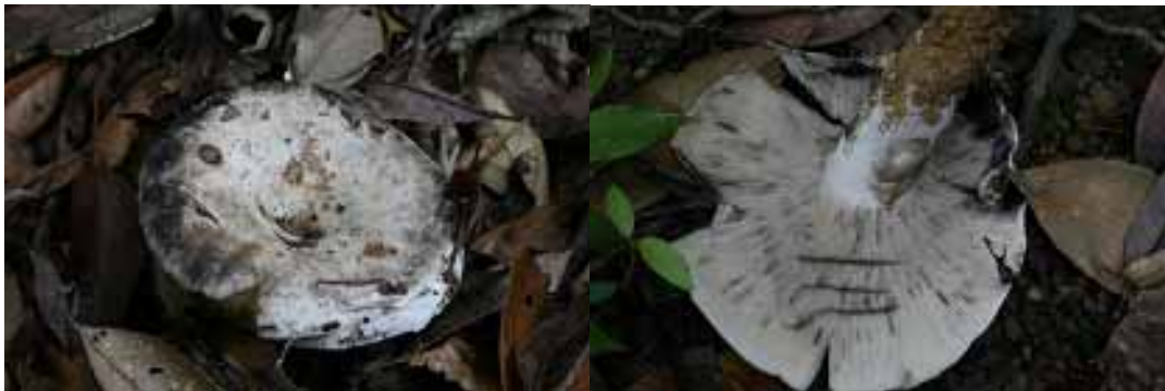
圖 14. 煙色紅菇

中型菇類，初生時，全株白色，之後因老熟或受傷，菇體表面會開始出現黑褐色污斑，整體看來就像被煙燻黑似的，因而得名。可摘取食用。