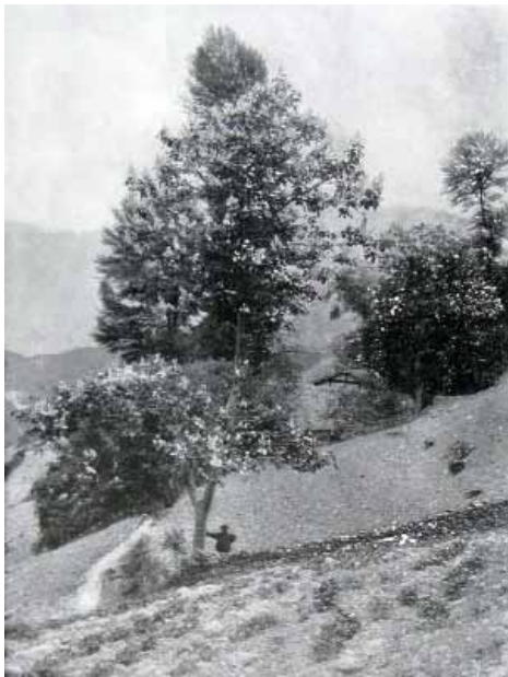
圖 2. 四川西部長江邊的泡桐樹

學研究有重要的貢獻。英國著名的邱植物園 (Kew Garden) 中許多中國植物就是由他攜回英國。其中 1908 那年，Wilson 由成都出發，經灌縣、漩口鎮、臥龍、日隆、小金川、丹巴、康定、瀘定、雅安、邛崃，回成都的旅行，是中國植物學調查的經典之旅，對後來的研究有重大的啟發。