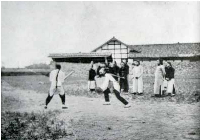
圖 3. 成都華西大學的學生在打棒球(R. T. Chamberlin)

文章對當時四川的風土人情，尤其是成都平原，有詳盡的介紹。不過作者對於成都平原的命名，頗為岷江抱屈。他說有岷江才有平原，有平原才有城市，平原應該稱為岷江平原。儘管對名稱有意見，Chamberlin 還是對成都平原豐饒的農產和美麗的風景留下深刻的印象。由文章的附圖可見，成都平原的田園風光，確實不愧有天府之國的稱號；也顯然可見，當時四川完全談不上現代化。運輸仍然依賴人力的獨輪車，甚至是挑夫背上的籬筐；灌溉仍然使用傳統的水車。但是在外國教會創辦的成都華西大學，留著辮子的學生已經學會打棒球了（圖3）。文中也談到當時成都城西的滿人城區，有獨立的城牆，漢人不能隨便進入。這一期國家地理雜誌出刊的時候（1911年12月），這個禁忌應該已經打破了。