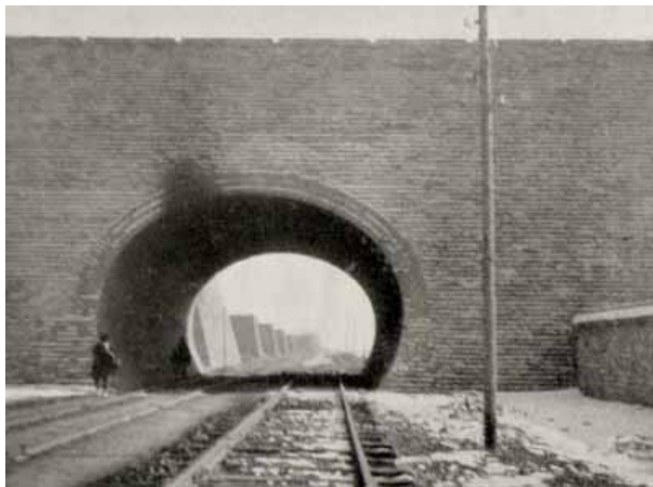
圖 4. 北京崇文門旁穿過城牆的鐵路，1902 年英軍興建。