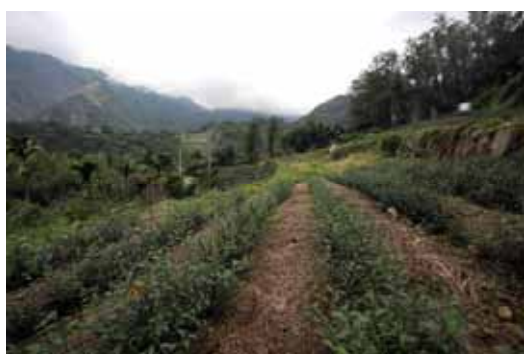
圖 3. Fiofions 遺址

特富野聚落一帶有幾個重要的史前遺址，其中Tfuya 5 遺址位於特富野聚落旁，1902年由森丑之助發現，近年來因為茶園整地、現代墓地及村落建築物受到嚴重破壞，雖然還可以撿到一些石器，但保存狀況相當糟糕。Yingiana 6 遺址在特富野東南方約 600 公尺處，原為緩坡，但已開闢為梯田，成為溫室和茶園，遺址可能因此受到相當程度的破壞。前文提過，Yingiana遺址是阿里山區史前文化的命名遺址，地位重要。從地層斷面看來，文化層堆積相當厚，地表還可以撿到一些石器，未來應該繼續發掘，深入研究。