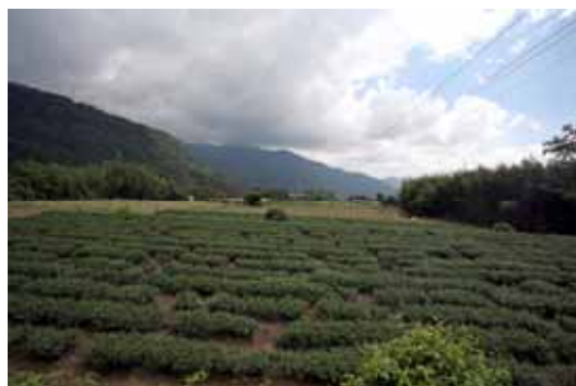
圖 2. Veiyio 遺址

1998 年本館人類學組曾在 Veiyio 遺址北側，一處名為 Tamayayana 4 的地點，發掘了 2 具用砂岩石板組合而成的石棺，其中一具棺內的長度僅 72 公分，另一具 106 公分，都屬於短棺，與鹿野忠雄挖到的石棺形狀相似。雖然人骨已經完全腐化不存，但判斷當初的死者應該是以蹲踞的方式埋葬。