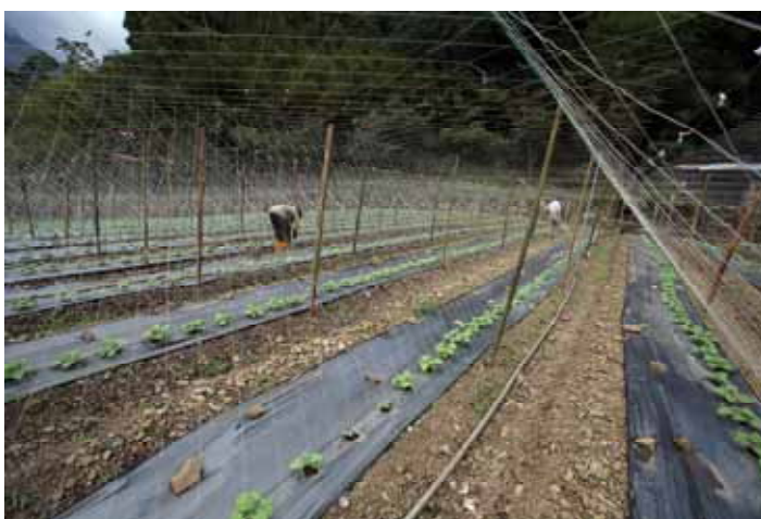
圖 6. 地表採集工作

表面上看來，我們這一天的工作可說是大豐收，採集到近 500 件石器。但實際上，正是因為當地居民不斷的拓墾行爲，大幅改變了地形地貌，破壞祖先幾千年來活動的遺留，才使得大量石器暴露地表。對考古學者來說，只有挖到地下未經擾動的文化層，才可能了解古人的生活方式，而零星發現的石器，能夠提供的線索就少得多了。