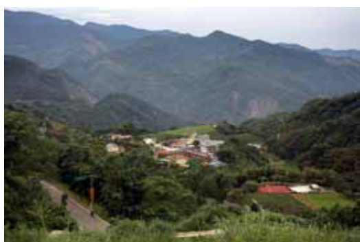
圖 1. 樂野部落

「在 Vuyio 3 遺址掘到石棺數具，以砂岩製成，長約 121 公分，寬約 36 公分，深約 45 公分，無底板。石器有薄型打製石斧頗多，並得磨製扁平偏鋒石斧、細型石鑿、石刀、石鏟等；陶器有附有網形印紋的紅色陶片和黑色陶片，無紋而含有石英之粗粒的厚陶片，以及陶製紡輪。」（宋文薰譯，1955：95）