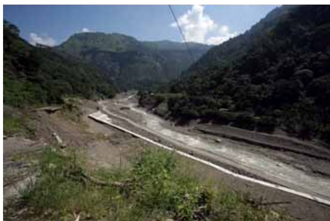
圖 7. 消失的山美大橋

山美村有個熱門景點稱為達娜伊谷，也是一處考古遺址，但是當我們預備前往時，赫然發現不但跨越曾文溪的山美大橋沒了蹤影（圖7），連溪谷兩側的公路也柔腸寸斷，最後還是繞了遠路，走溪底便橋才過了溪，但是達娜伊谷卻不可能到了。