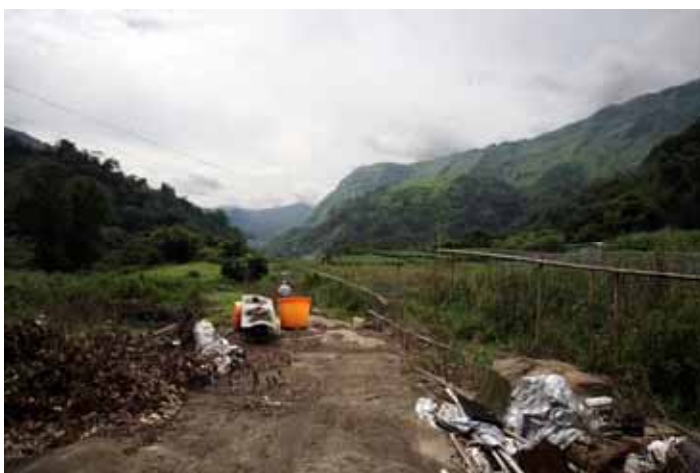
圖 5. 達德安 3 號遺址

Taptuana (達德安) 小聚落在達邦聚落西南方約 1.5 公里處，聚落周邊共有 3 個地點曾發現史前遺物，但以 Taptuana 3 號遺址 (圖 5、6) 遺物最多。要到達這個地點，必須沿著產業道路曲折而陡峭下行，等垂直下降約 100 多公尺後，就會到達一片比較平緩的農地，只見地表遍地都是史前遺物，我們挑肥揀瘦，只拿完整的石器，一會兒就撿了近 300 件，再也搬不動了，而且還只踏查了這片田地的一小部分，密度真是太驚人了。